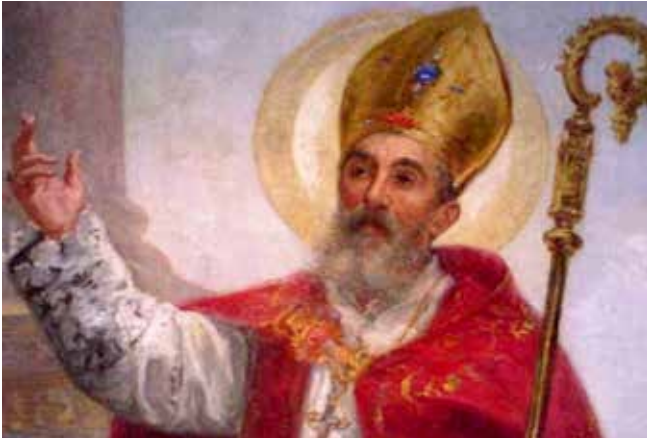
obra: la disputa antiarriana.